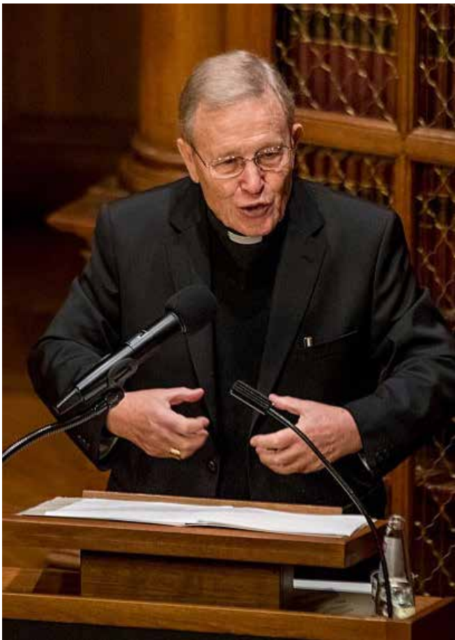
Walter Kardinal Kasper