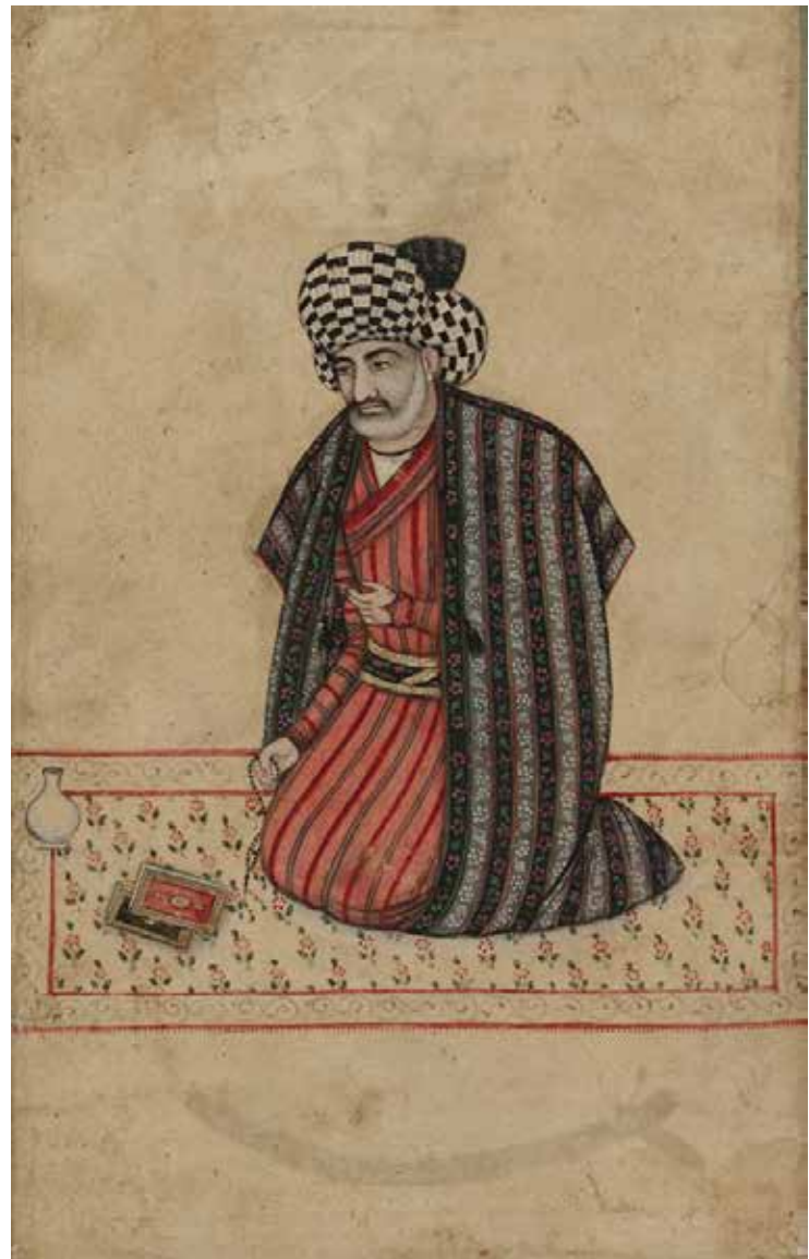
Muhammad Baqir al-Majlisi b. Muhammad-Taqi b. Maqṣud-‘Ali Eṣfahāni

17 Der Koran kennt diese Überlieferung nicht. Im Hintergrund aber könnte stehen, der Versuch die Verse: „116 Und (damals) als Gott sagte: ‚Jesus, Sohn der Maria! Hast du (etwa) zu den Leuten gesagt: ‚Nehmt