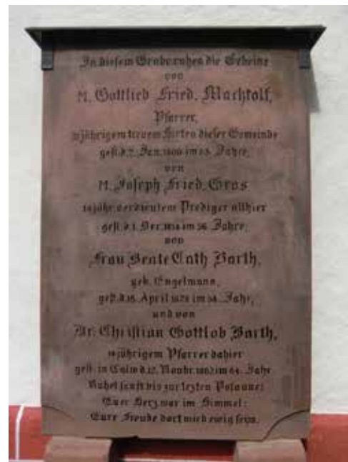
Christian Gottlob Barth Grabstein