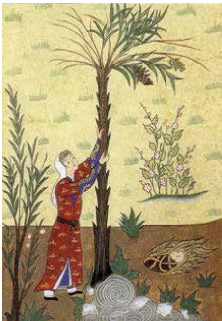
Maria und Jesus - Islam