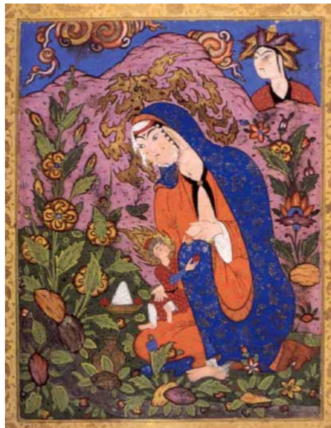
Maria und Jesus - Islam

von Frausein und Priestertum können auch durch etwas anderes ausgelöst worden sein, als durch eine Randerscheinung in der Arabia [40] .